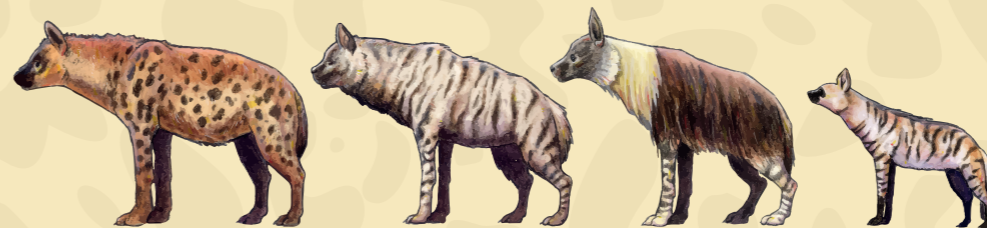
HYENA ŠKVRNITÁ (Crocuta crocuta) - Najväčšia